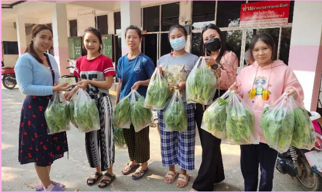
กิจกรรมส่งเสริมอาชีพปลูกผัก