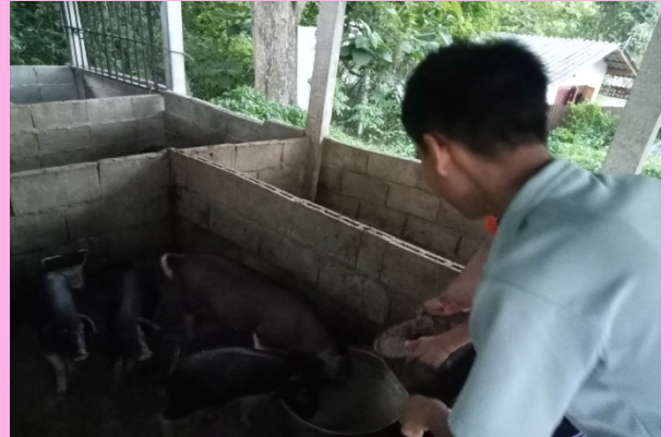
กิจกรรมส่งเสริมอาชีพเลี้ยงหมู