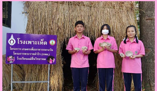
กิจกรรมส่งเสริมอาชีพเพาะเห็ดนางฟ้า