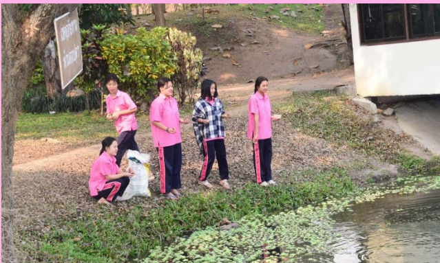
กิจกรรมส่งเสริมอาชีพเลี้ยงปลา