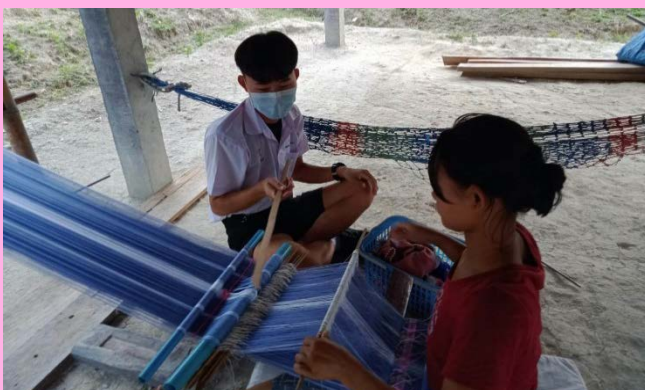
กิจกรรมส่งเสริมอาชีพทอผ้ากะเหรี่ยง