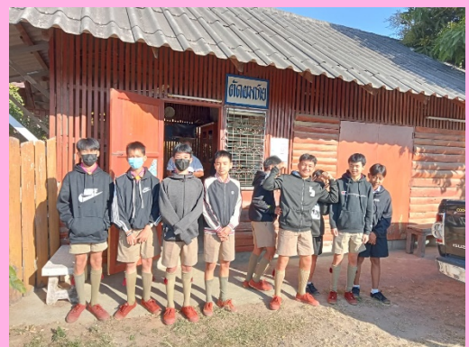
กิจกรรมส่งเสริมอาชีพตัดผมชาย